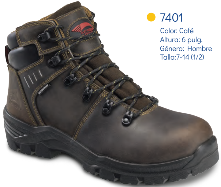
● 7401 Color: Café Altura: 6 pulg. Género: Hombre Talla: 7-14 (1/2)