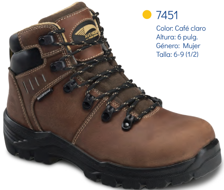
● 7451 Color: Café claro Altura: 6 pulg. Género: Mujer Talla: 6-9 (1/2)